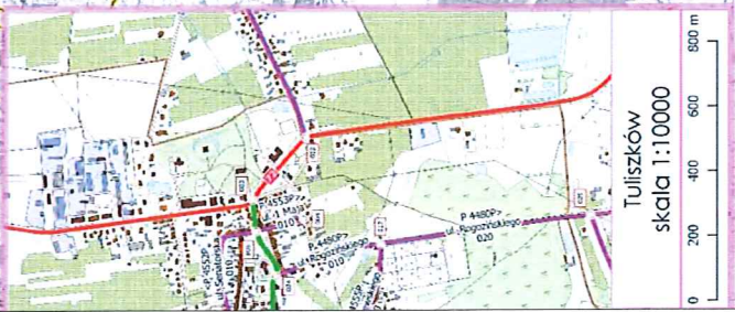
Turusków skala 1:10000