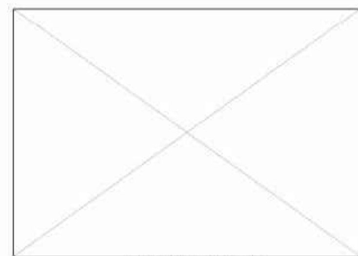
szkic arkuszy sąsiednich

Mapa do celów projektowych została wykonana bez ustalenia obciążeń służebnościami gruntowymi ujawnionymi w księgach wieczystych